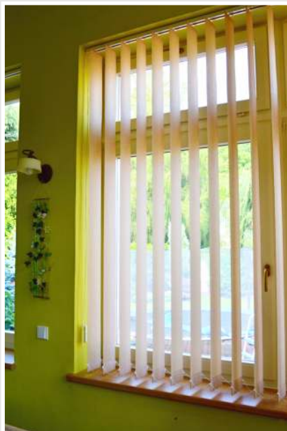
žaluzie namontovaná v otvoru