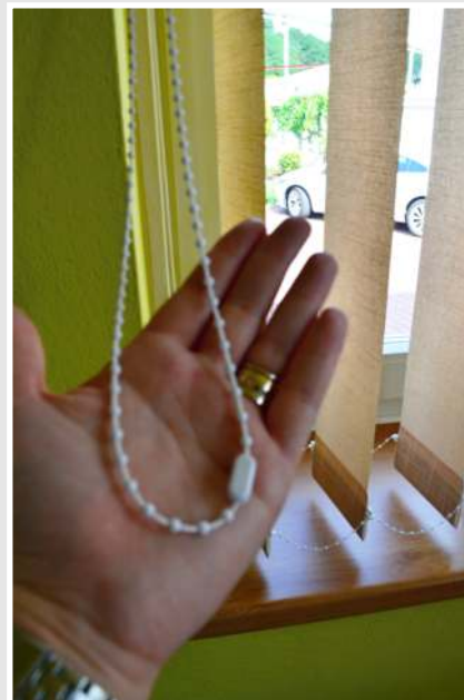
ovládací řetízek na otočení lamel