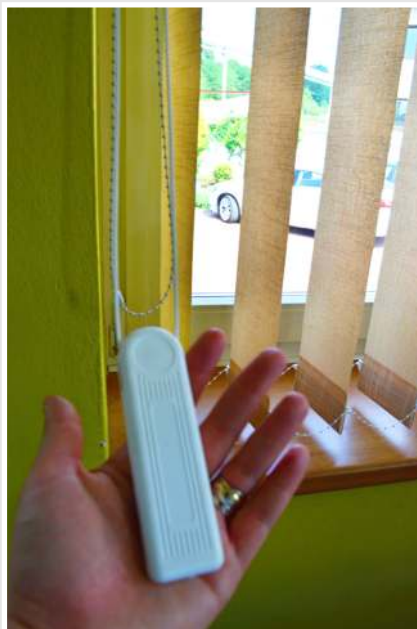
ovládací táhlo na shrnutí žaluzie