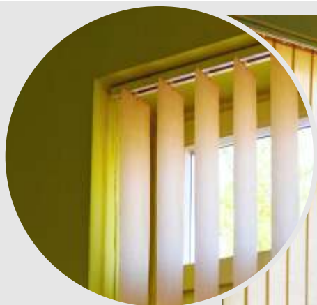
žaluzie v otvoru

6) vyzkoušíme zda je chod žaluzie bezproblémový a máme namontováno