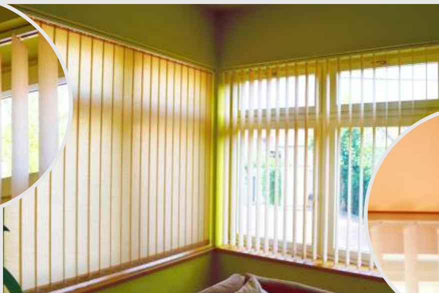
ukázka vertikální žaluzie