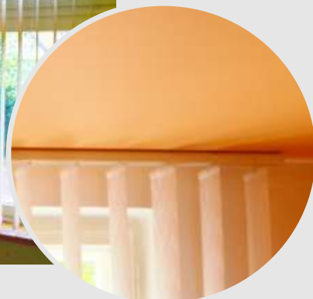
žaluzie před otvor