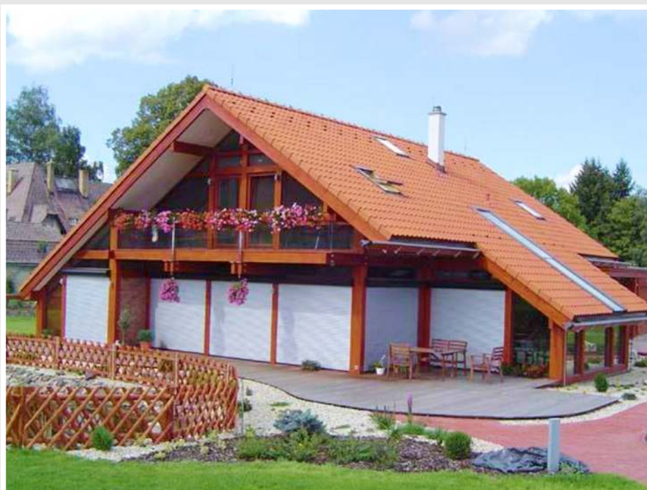
ukázka předokenní rolety