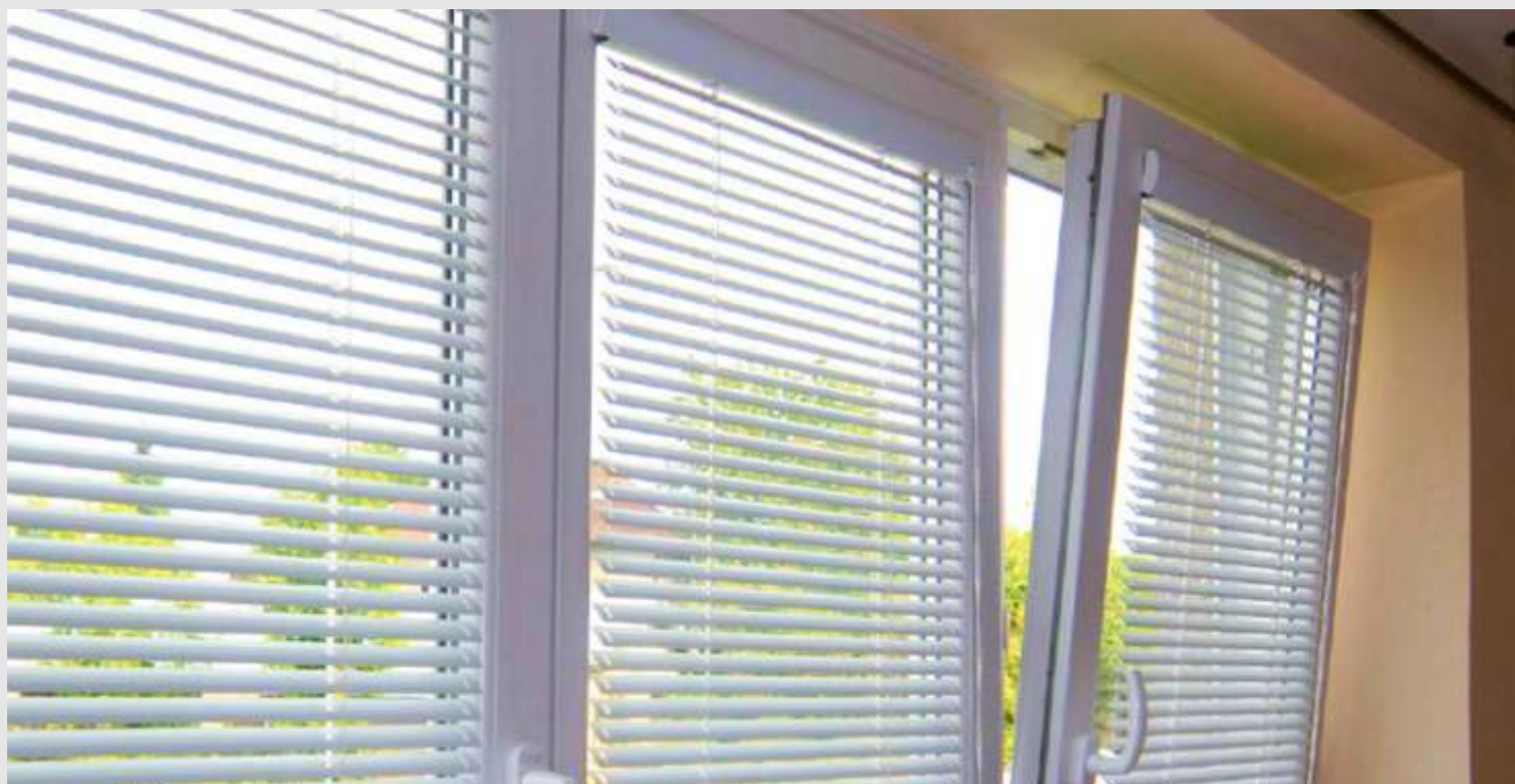
ukázka žaluzie MAX25