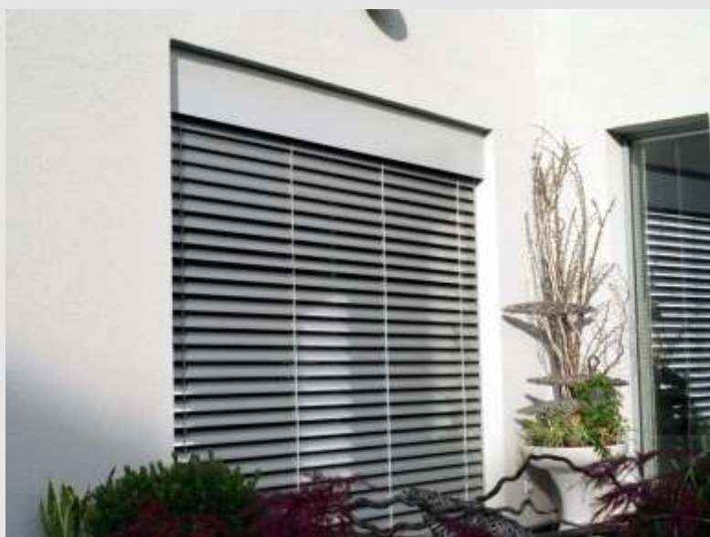
ukázka venkovní žaluzie EXT 50

Strana ovládání se stanovuje při pohledu z místnosti! Přesněji pak z toho místa, odkud se přistupuje k ovládacímu zařízení.