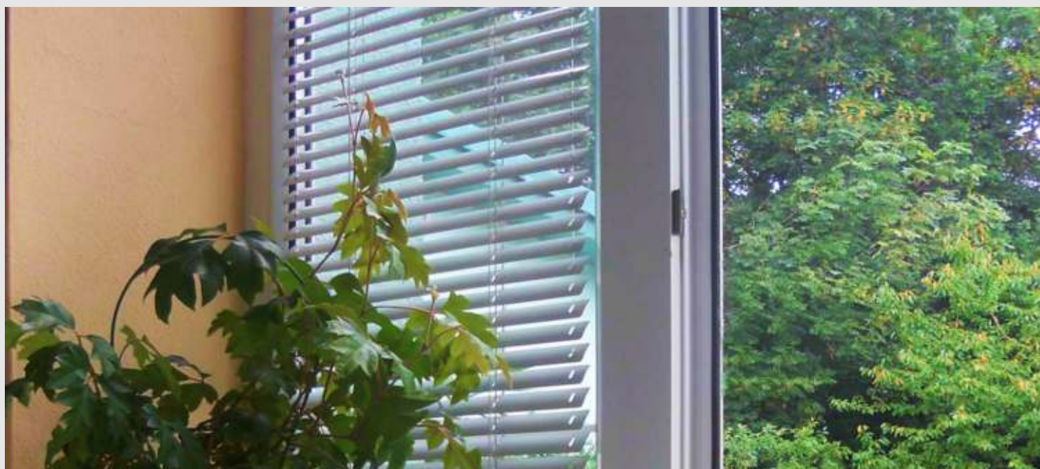
ukázka žaluzie EKO s brzdou