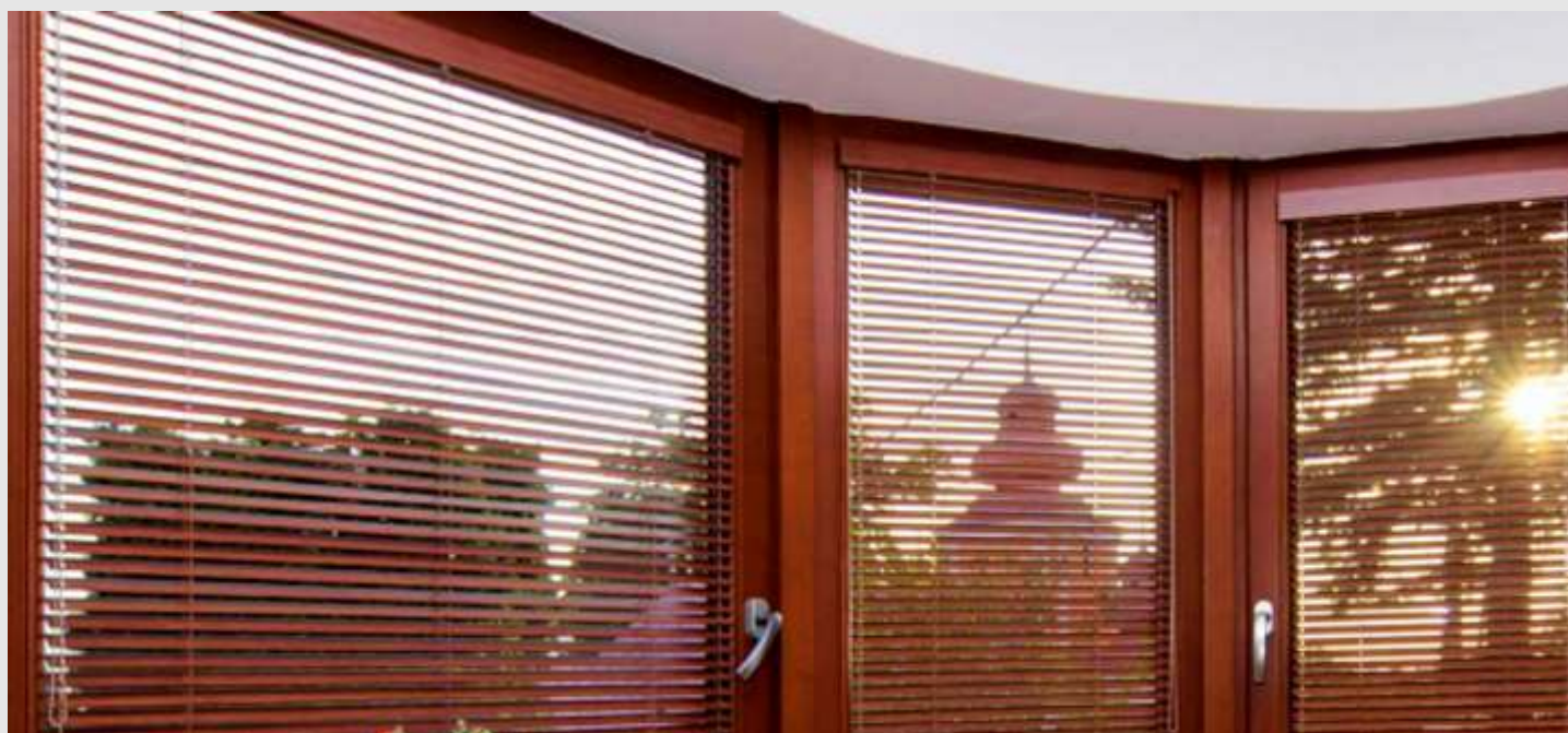
Ukázka bambusové žaluzie E25