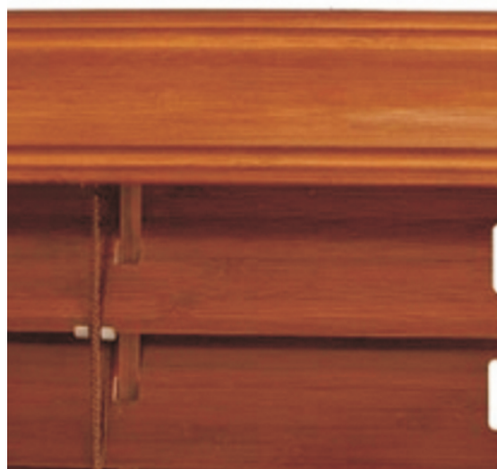
Výška stažené žaluzie (nábalu)