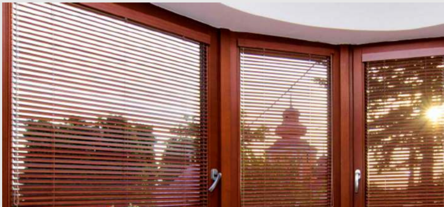
Ukázka bambusové žaluzie B25